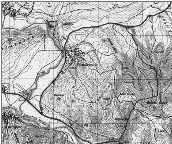
Slika 2. Karta istraživanog područja