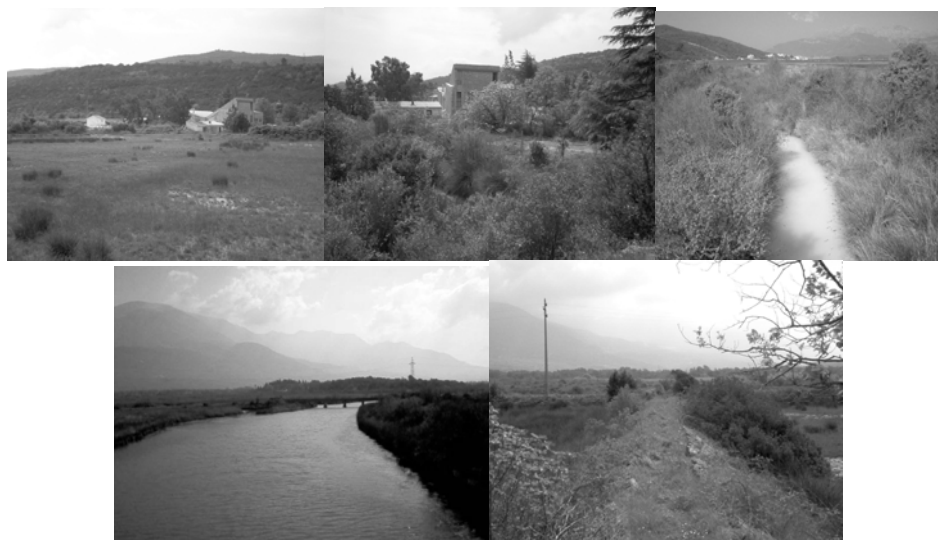
Slika 3. Antropogeni uticaji na području Tivatskih Solila

L- liberalam, ograničeno korišćenja prirodnih resursa- O, veoma restriktivan- R isključeno korišćenje- I