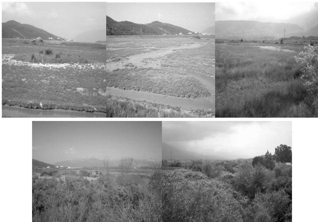
Slika 2. Različiti tipovi staništa Tivatskih Solila

Površina istraživanog područja je 30 ha sa geografskim koordinatama: 18^{\circ} 43' 10'' istočne geografske širine i 42^{\circ} 23' 50'' severne geografske dužine.